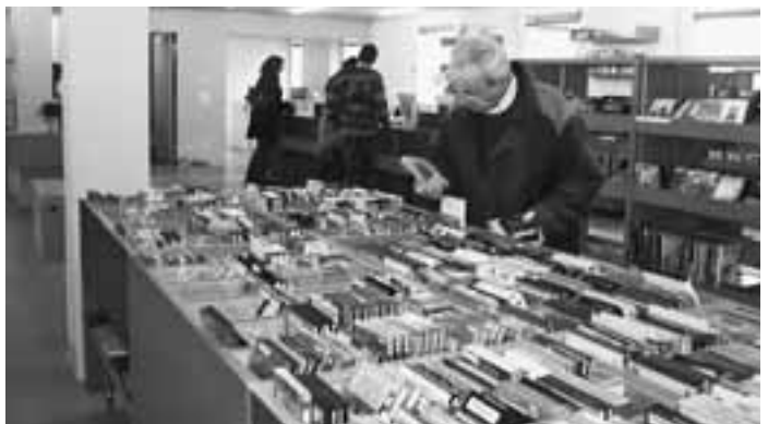
Die erweiterte Bibliothek Altstetten