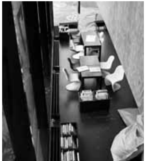
Kinderecke in der Bibliothek Sihlcity