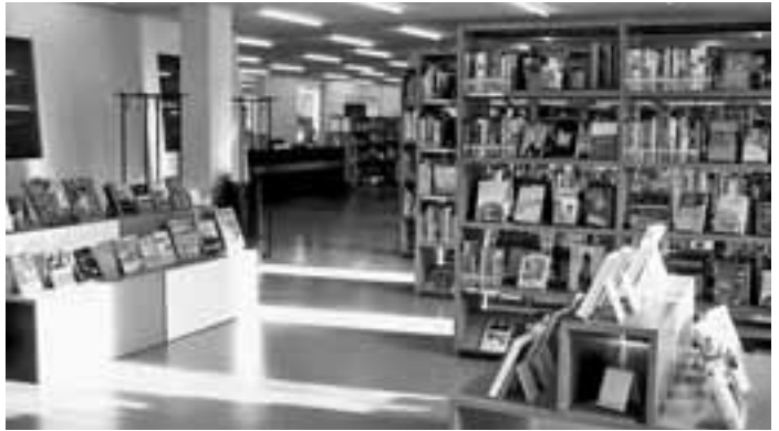
Die renovierte Bibliothek Altstetten