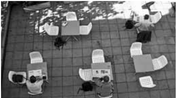
Terrasse der Bibliothek Altstadt