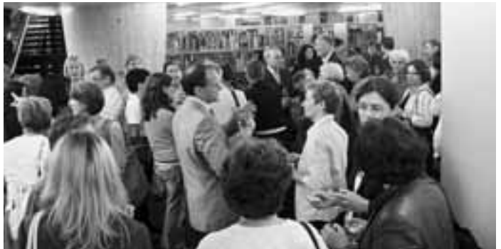
Eröffnungspéro der Bibliothek Sihlcity