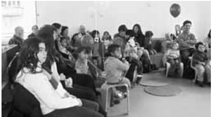
Einweihungsfest der Bibliothek Altstetten am 27. Januar 2007