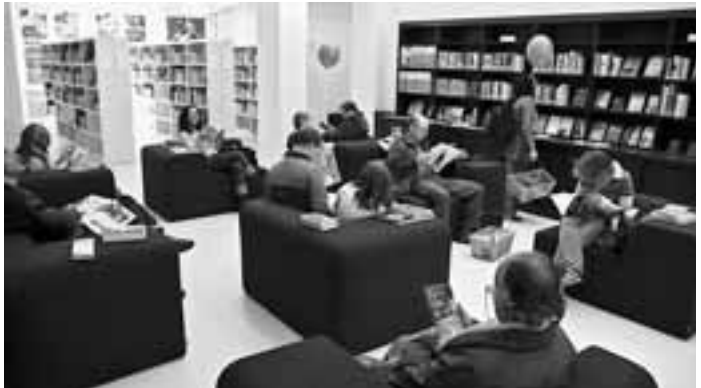
Leselounge in der renovierten Bibliothek Altstadt